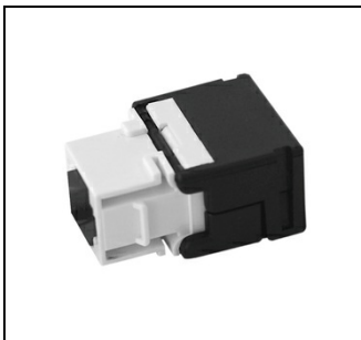
ZE311 Buchse RJ45 Kunststoff EAN 4011617386124 Art.-Nr. 2CPX038612R9999 Listenpreis 16,25 €