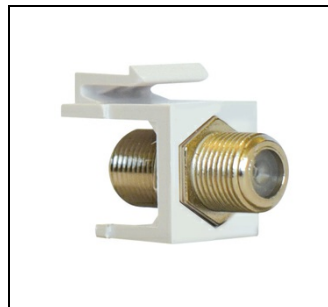
ZE316 KOAX Modul F F Buchse EAN 4011617392460 Art.-Nr. 2CPX039246R9999 Listenpreis 24,90 €