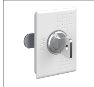
UZT3 Sicherheits-Schloß UK600 EAN 4011617314127 Art.-Nr. 2CPX031412R9999 Listenpreis 21,30 €