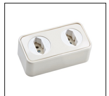
ZE225 Doppel Schuko Steckdose EAN 4011617611776 Art.-Nr. 2CPX061177R9999 Listenpreis 33,20 €