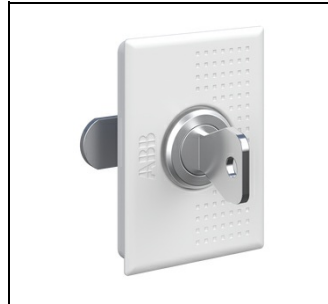
UZT4 Sicherheitsschloß FR EAN 4011617314134 Art.-Nr. 2CPX031413R9999 Listenpreis 21,30 €