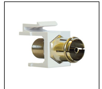
ZE317 KOAX Modul IEC Buchse EAN 4011617392477 Art.-Nr. 2CPX039247R9999 Listenpreis 25,00 €