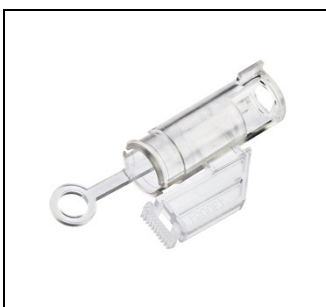
UZ91P4 Hohlwandset zu UK600 EAN 4011617314349 Art.-Nr. 2CPX031434R9999 Listenpreis 19,35 €