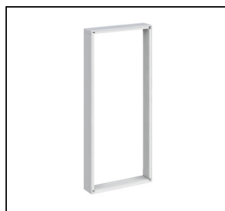
AP660 aP-Bausatz zu UK 5R EAN 4011617314066 Art.-Nr. 2CPX031406R9999 Listenpreis 58,00 €