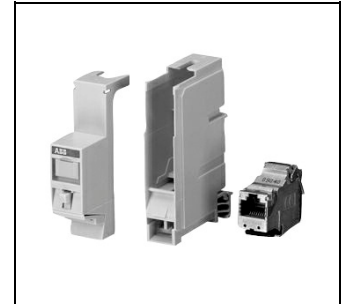
ZE310 Patchmodul RJ45 EAN 4011617386254 Art.-Nr. 2CPX038625R9999 Listenpreis 28,00 €