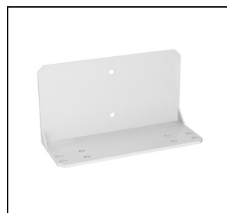
ZX29 Montagetraverse f. ZE225 EAN 4011617611783 Art.-Nr. 2CPX061178R9999 Listenpreis 8,70 €