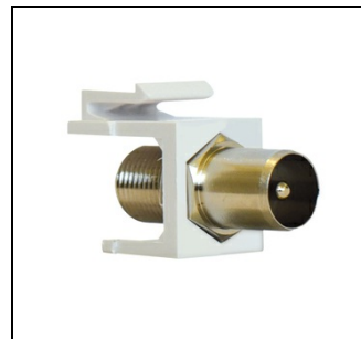
ZE318 KOAX Modul IEC Stecker EAN 4011617392484 Art.-Nr. 2CPX039248R9999 Listenpreis 25,00 €