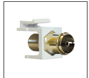
ZE317 KOAX Modul IEC Buchse EAN 4011617392477 Art.-Nr. 2CPX039247R9999 Listenpreis 25,00 €