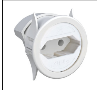
ZE224 Einbausteckdose + EURO ad. EAN 4011617314271 Art.-Nr. 2CPX031427R9999 Listenpreis 21,30 €