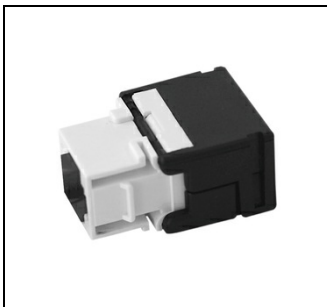
ZE311 Buchse RJ45 Kunststoff EAN 4011617386124 Art.-Nr. 2CPX038612R9999 Listenpreis 16,25 €