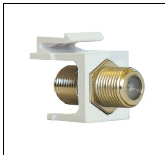
ZE316 KOAX Modul F F Buchse EAN 4011617392460 Art.-Nr. 2CPX039246R9999 Listenpreis 24,90 €