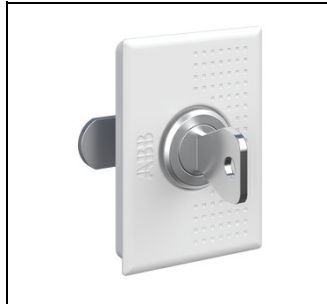
UZT4 Sicherheitsschloß FR EAN 4011617314134 Art.-Nr. 2CPX031413R9999 Listenpreis 21,30 €