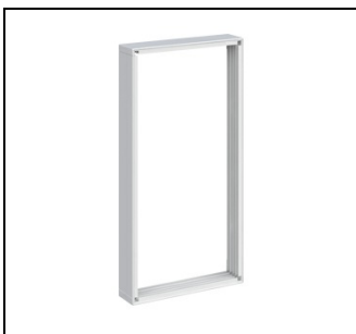
AP648 aP-Bausatz zu UK 4R EAN 4011617314059 Art.-Nr. 2CPX031405R9999 Listenpreis 48,80 €