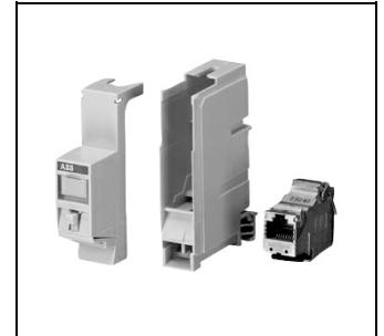
ZE310 Patchmodul RJ45 EAN 4011617386254 Art.-Nr. 2CPX038625R9999 Listenpreis 28,00 €