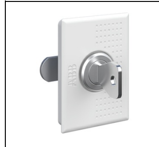
UZT3 Sicherheits-Schloß UK600 EAN 4011617314127 Art.-Nr. 2CPX031412R9999 Listenpreis 21,30 €