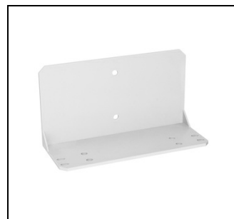
ZX29 Montagetraverse f. ZE225 EAN 4011617611783 Art.-Nr. 2CPX061178R9999 Listenpreis 8,70 €