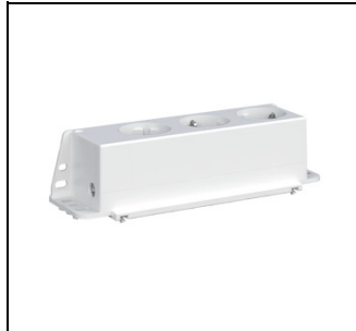
ZE227 3-fach Steckdose EAN 4011617612117 Art.-Nr. 2CPX061211R9999 Listenpreis 82,50 €