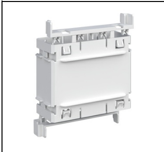
UZB2 Verbindungsset UK600 EAN 4011617314080 Art.-Nr. 2CPX031408R9999 Listenpreis 17,15 €