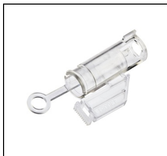
UZ91P4 Hohlwandset zu UK600 EAN 4011617314349 Art.-Nr. 2CPX031434R9999 Listenpreis 19,35 €