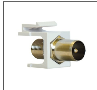
ZE318 KOAX Modul IEC Stecker EAN 4011617392484 Art.-Nr. 2CPX039248R9999 Listenpreis 25,00 €