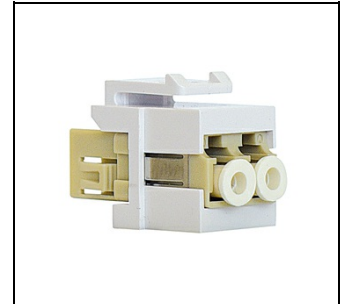
ZE319 Op DAT Modul EAN 4011617392491 Art.-Nr. 2CPX039249R9999 Listenpreis 23,70 €