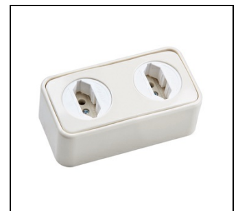
ZE225 Doppel Schukosteckdose EAN 4011617611776 Art.-Nr. 2CPX061177R9999 Listenpreis 33,20 €