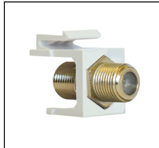
ZE316 KOAX Modul F F Buchse EAN 4011617392460 Art.-Nr. 2CPX039246R9999 Listenpreis 24,90 €