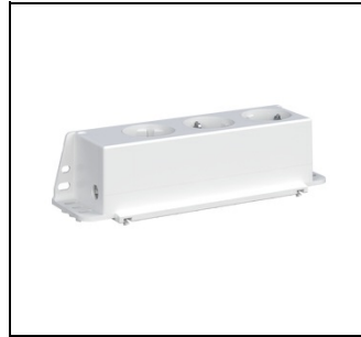
ZE227 3-fach Steckdose EAN 4011617612117 Art.-Nr. 2CPX061211R9999 Listenpreis 82,50 €