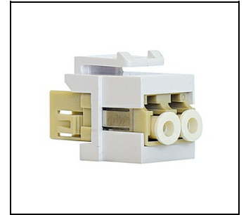
ZE319 Op DAT Modul EAN 4011617392491 Art.-Nr. 2CPX039249R9999 Listenpreis 23,70 €