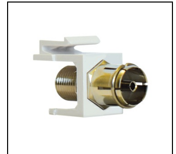
ZE317 KOAX Modul IEC Buchse EAN 4011617392477 Art.-Nr. 2CPX039247R9999 Listenpreis 25,00 €