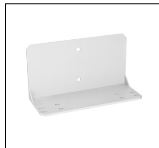
ZX29 Montagetraverse f. ZE225 EAN 4011617611783 Art.-Nr. 2CPX061178R9999 Listenpreis 8,70 €