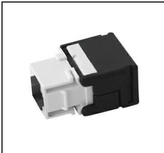
ZE311 Buchse RJ45 Kunststoff EAN 4011617386124 Art.-Nr. 2CPX038612R9999 Listenpreis 16,25 €