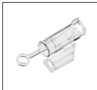
UZ91P4 Hohlwandset zu UK600 EAN 4011617314349 Art.-Nr. 2CPX031434R9999 Listenpreis 19,35 €