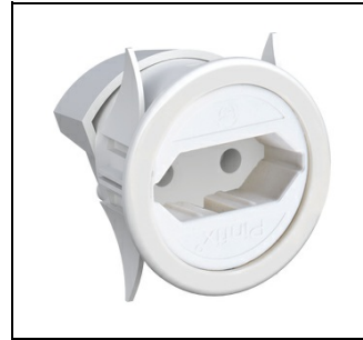
ZE224 Einbausteckdose + EURO ad. EAN 4011617314271 Art.-Nr. 2CPX031427R9999 Listenpreis 21,30 €