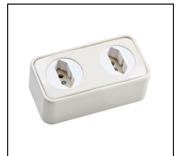
ZE225 Doppel Schukosteckdose EAN 4011617611776 Art.-Nr. 2CPX061177R9999 Listenpreis 33,20 €