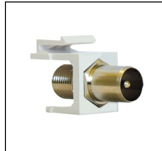
ZE318 KOAX Modul IEC Stecker EAN 4011617392484 Art.-Nr. 2CPX039248R9999 Listenpreis 25,00 €