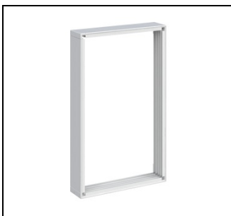
AP636 aP-Bausatz zu UK 3R EAN 4011617314042 Art.-Nr. 2CPX031404R9999 Listenpreis 45,20 €